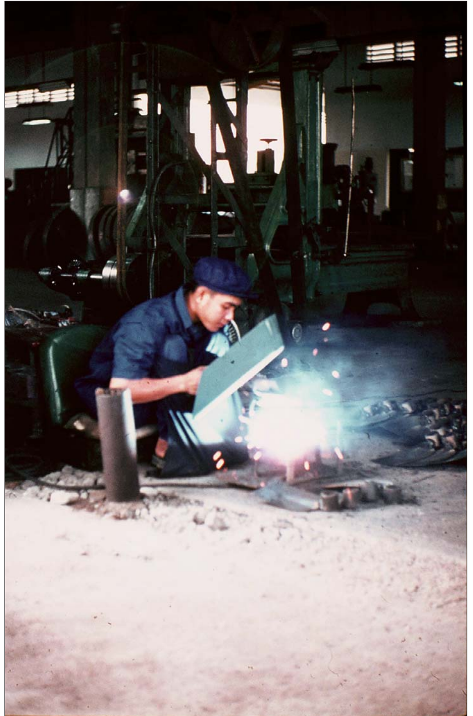
កម្មកររោងចក្រនៅទីក្រុងភ្នំពេញ