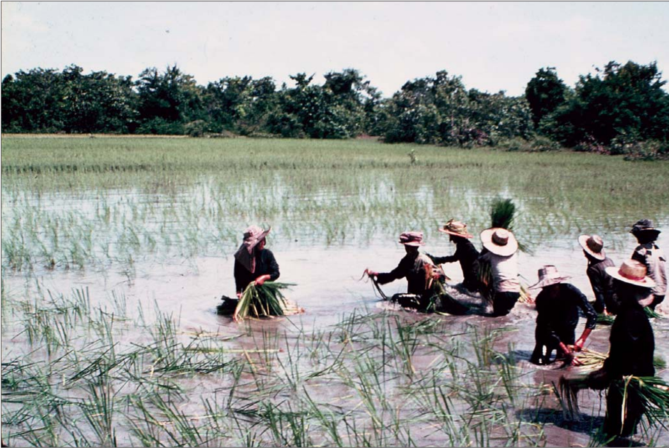
វាលស្រែនៅភាគឆ្នូតពីកំពង់ចាម