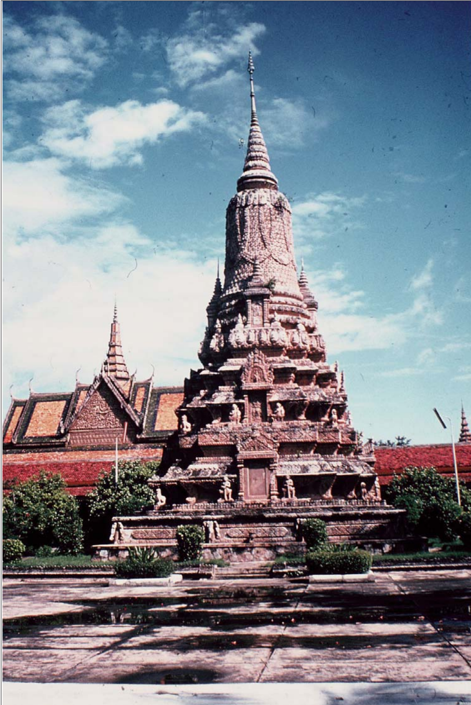
ចេតិយនៅក្នុងបរិវេណព្រះបរមរាជវាំង