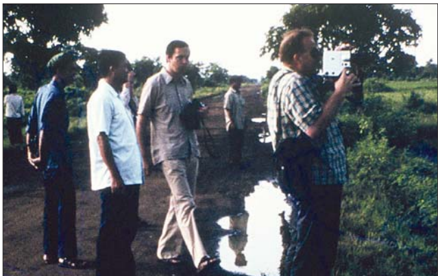
ការឈប់សំចតនៅតាមផ្លូវដើម្បីត្រួតពិនិត្យប្រតិភូចត្រូវ និងថតរីដេអូ

នៅថ្ងៃទី១២ ខែសីហា ឆ្នាំ១៩៧៨ យន្តហោះពីទីក្រុង ប៉េកាំងប្រទេសចិនបានចុះចតនៅព្រលានយន្តហោះពោធិ- ចិនតុង ។ ខ្ញុំជាសមាជិកម្នាក់ក្នុងចំណោមសមាជិកបួននាក់នៃ គណៈប្រតិភូស៊ុយអែងដែលត្រូវបានអញ្ជើញមកធ្វើទស្សនកិច្ច នៅកម្ពុជាប្រជាធិបតេយ្យ ។ នៅក្រោមរបបខ្មែរក្រហម មិនមានជនបរទេសច្រើនទេដែលបានទទួលការអនុញ្ញាតធ្វើ ទស្សនកិច្ចនៅប្រទេសកម្ពុជា ។ អ្នកដែលបានចូលមកក៏ជាអ្នក ការទូត សមាគមមិត្តភាព ឬគណៈប្រតិភូដែលគាំទ្រមនោ- មនោគមន៍វិជ្ជា ម៉ៅនិយម ។ ខ្ញុំយល់ថា ខ្មែរក្រហមសម្រេច ចិត្តថាខ្លួនត្រូវតែលាងជម្រះពាក្យចាមអាវ៉ាមអំពីការកាប់ សម្លាប់ ការធ្វើទារុណកម្ម និងការបំភិតបំភ័យ ដែលខ្លួន ប្រឈមមុខចាប់តាំងពីឡើងកាន់អំណាចនៅខែមេសា ឆ្នាំ ១៩៧៥ ។ ក៏ប៉ុន្តែខ្មែរក្រហមនៅតែបានម្តុំអំពីការគ្រប់គ្រង ស្ថានភាពនៅចំពោះមុខ និងបង់ឲ្យប្រាកដក្នុងចិត្តថាភ្ញៀវ ដែលខ្លួនអញ្ជើញមកនឹងមិនបង្កបញ្ហា ។ នៅពេលជិតដល់ ចុងបញ្ចប់នៃរបបរបស់ខ្លួន ខ្មែរក្រហមអញ្ជើញអ្នកកាសែត ឯករាជ្យពីរ- បីនាក់ទៅកម្ពុជា ។