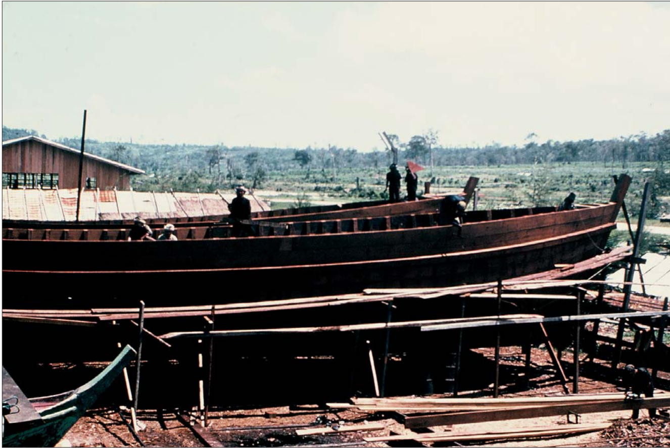
ការផលិតទូក