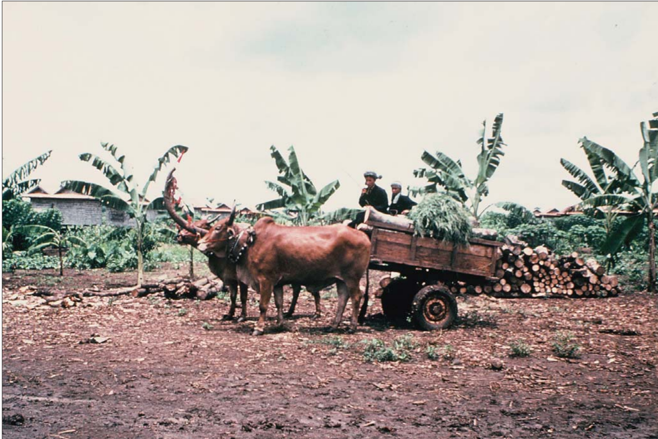
មេឡាបាយដឹកឧត្តុង្គនៅភាគអាគ្នេយ៍ នៃប្រទេស