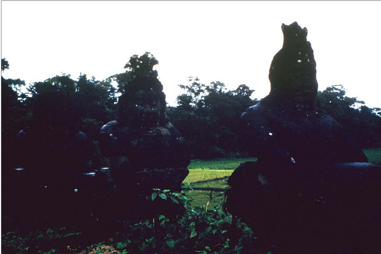
អង្គរ : ច្រកចូលប្រាសាទបាយ័ន