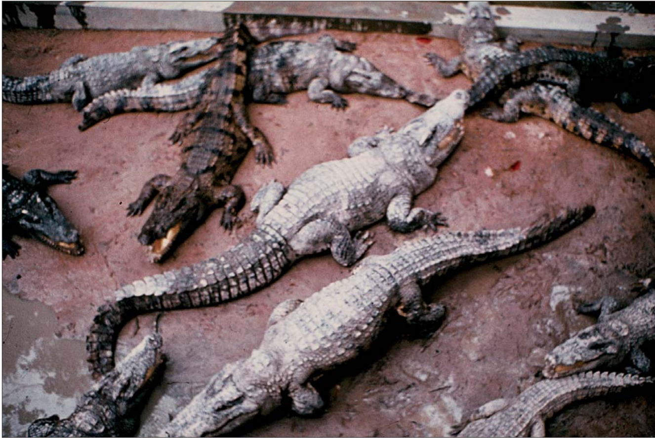
កសិដ្ឋានចិញ្ចឹមក្រូចពីរនាវស្រូវរាប