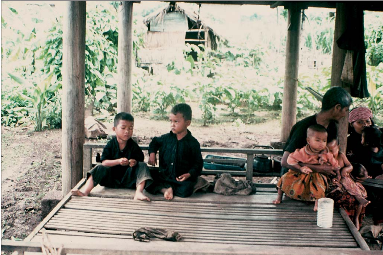
មណ្ឌលកុមារ