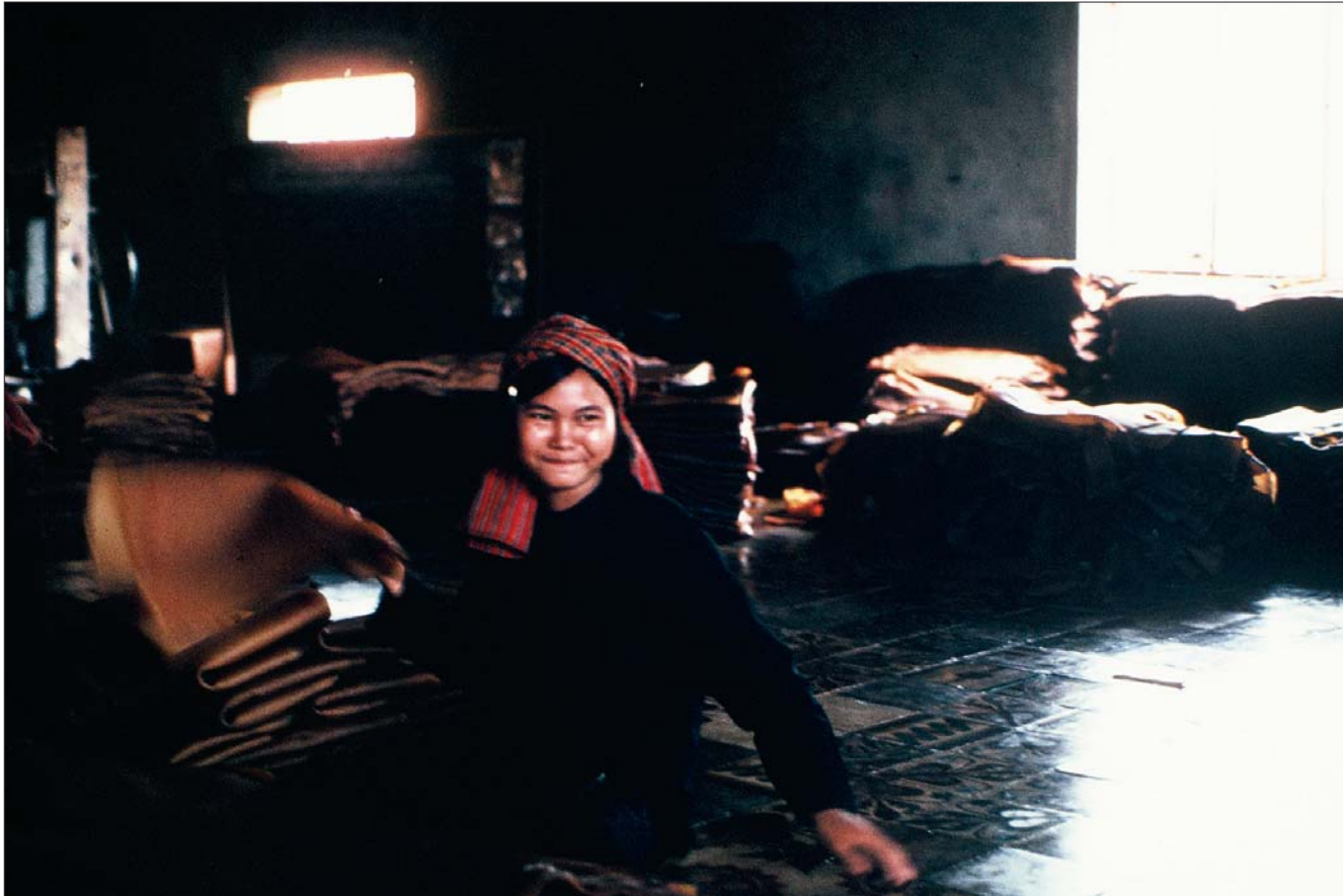
កម្មករនៅក្នុងរោងចក្រផ្គត់ផ្គង់កៅស៊ូ