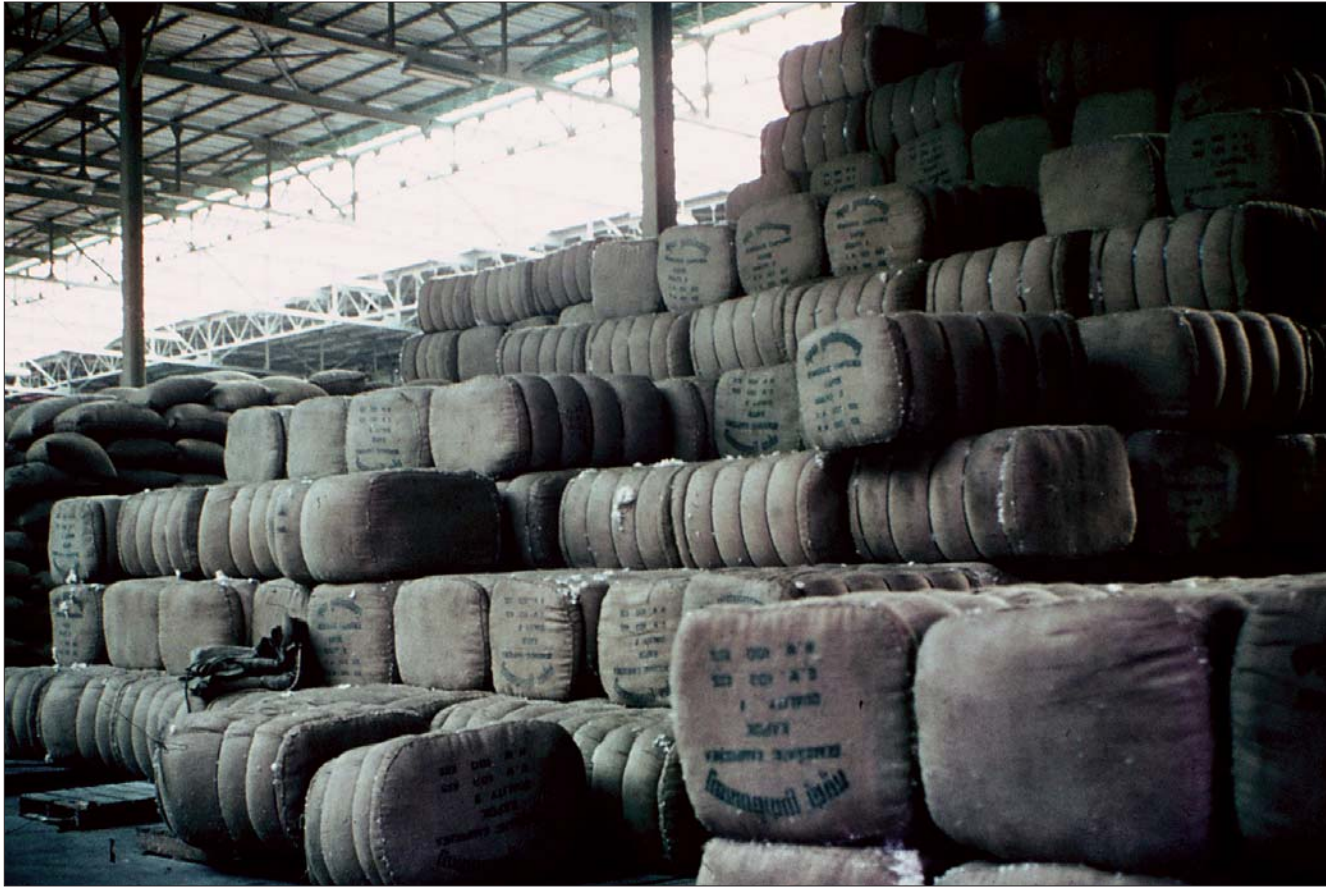
សំឡឹកសម្រាប់នាំចេញ