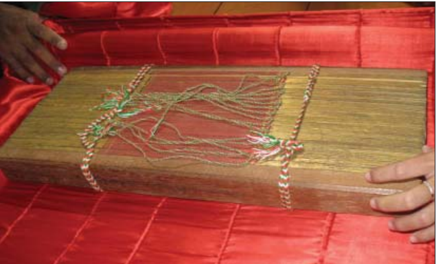
ស្ម័គ្រភ័ក្តិនៅក្នុងសតវត្សទី១៨ នៅប្រទេសកម្ពុជា

ដើម្បីឲ្យប្រាកដថាយើងនៅតែបំពេញការងារនេះក្នុងពេលអនាគតយើងកំពុងតែរៀបចំបង្កើតវិទ្យាស្ថានអចិន្ត្រៃយ៍មួយដែលយើងដាក់ឈ្មោះថា “វិទ្យាស្ថានស្ម័គ្រភ័ក្តិ” ។ វិទ្យាស្ថានស្ម័គ្រភ័ក្តិ នឹងដើរតួនាទីជាមជ្ឈមណ្ឌលឯកសារកម្ពុជាអចិន្ត្រៃយ៍ ដែលរួមមានមជ្ឈមណ្ឌលស្រាវជ្រាវនិងបណ្តុះបណ្តាល បណ្តាលយ សារមន្ទីរ និងមជ្ឈមណ្ឌលសារព័ត៌មាន ។ និយាយជាមួយ មជ្ឈមណ្ឌលស្ម័គ្រភ័ក្តិ ដើរតួជាវិទ្យាស្ថានកម្ពុជាមួយដែលប្រឆាំងនឹងអំពើប្រល័យពូជសាសន៍នៅកម្ពុជានៅអាស៊ី និងនៅទូទាំងពិភពលោក ។ ឈ្មោះដែលយើងជ្រើសរើសដាក់ឲ្យវិទ្យាស្ថាននេះបញ្ជាក់គោលដៅចម្បងរបស់យើងនិងកេរ្តិ៍ដំណែលវប្បធម៌ខ្មែរ ។ ស្ម័គ្រភ័ក្តិ គឺជាស្លឹកក្រាមហាលស្ងួត ដែលត្រូវស្រួតស្រួលដូចជាប្រាជ្ញប្រើសម្រាប់កត់ត្រាហេតុការណ៍ប្រវត្តិសាស្ត្រ វប្បធម៌ និងកម្មវិធីសាសនា ជាមធ្យោបាយថែរក្សាវប្បធម៌ និងបែកបែកចំណេះដឹងទៅមនុស្សជំនាន់ក្រោយ ។ ស្ម័គ្រភ័ក្តិ ជាតំណាងឲ្យចំណង់វប្បធម៌និងប្រវត្តិសាស្ត្ររវាងកម្ពុជានិងប្រទេសជិតខាងដូចជាកម្ពុជា