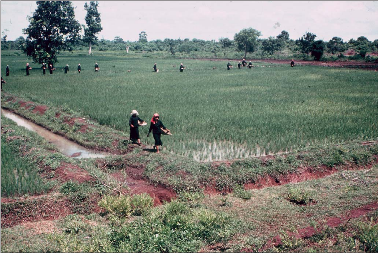
ស្រ្តីវ័យកណ្តាលធ្វើការនៅក្នុងវាលស្រែ