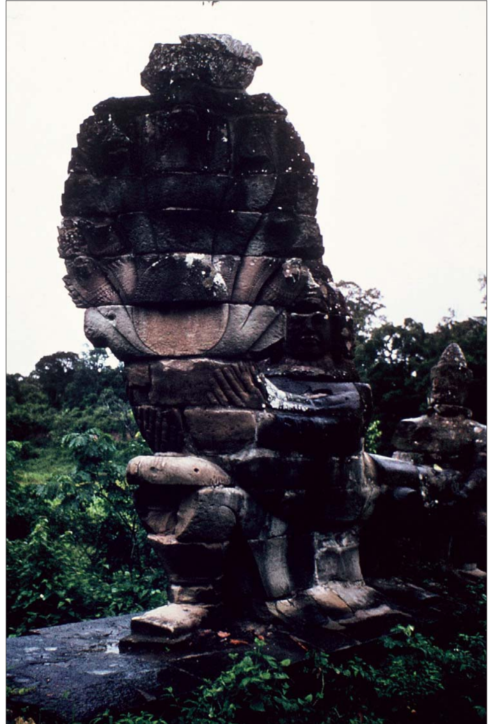
អង្គរ : ប្រកបដោយប្រាសាទជាយ៉ាង