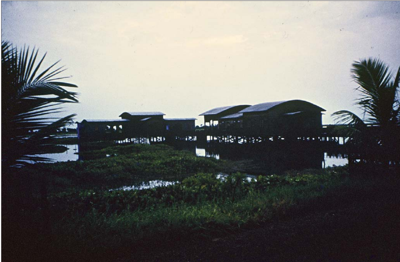
ផ្ទះសំណាក់នៅក្រៅទីរួមខេត្តកំពង់ធំ