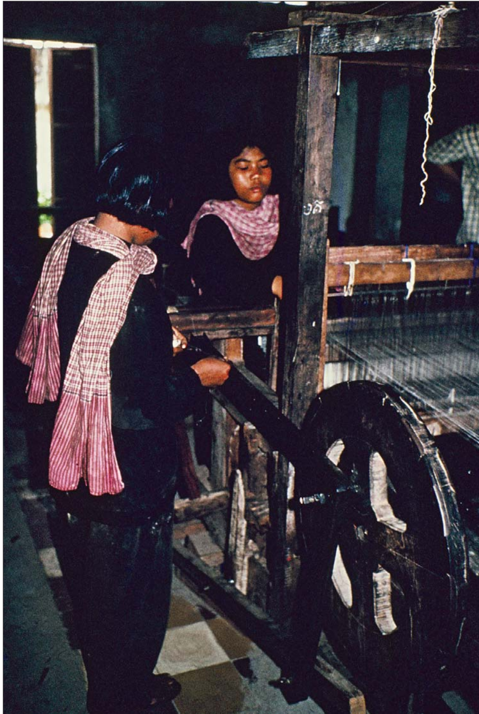
កម្មករតម្បាញ