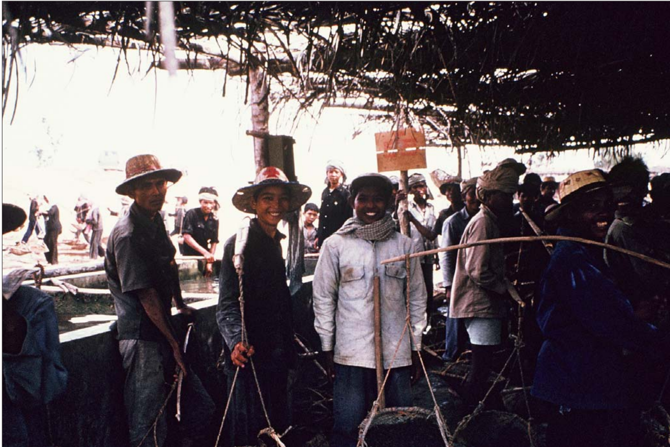
សមាជិកកងចល័តនៅការដ្ឋានសាលាសង្កែន ប្រឡាយ