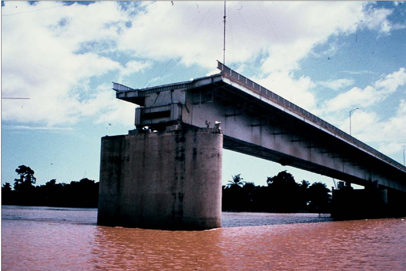
ស្ថានទ្រៀមចង្វារដែលជាប់ដោយសារការ ទម្លាក់គ្រាប់បែក (ភ្នំពេញ)