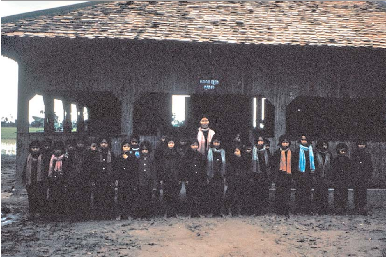
សាលាវ្យាង