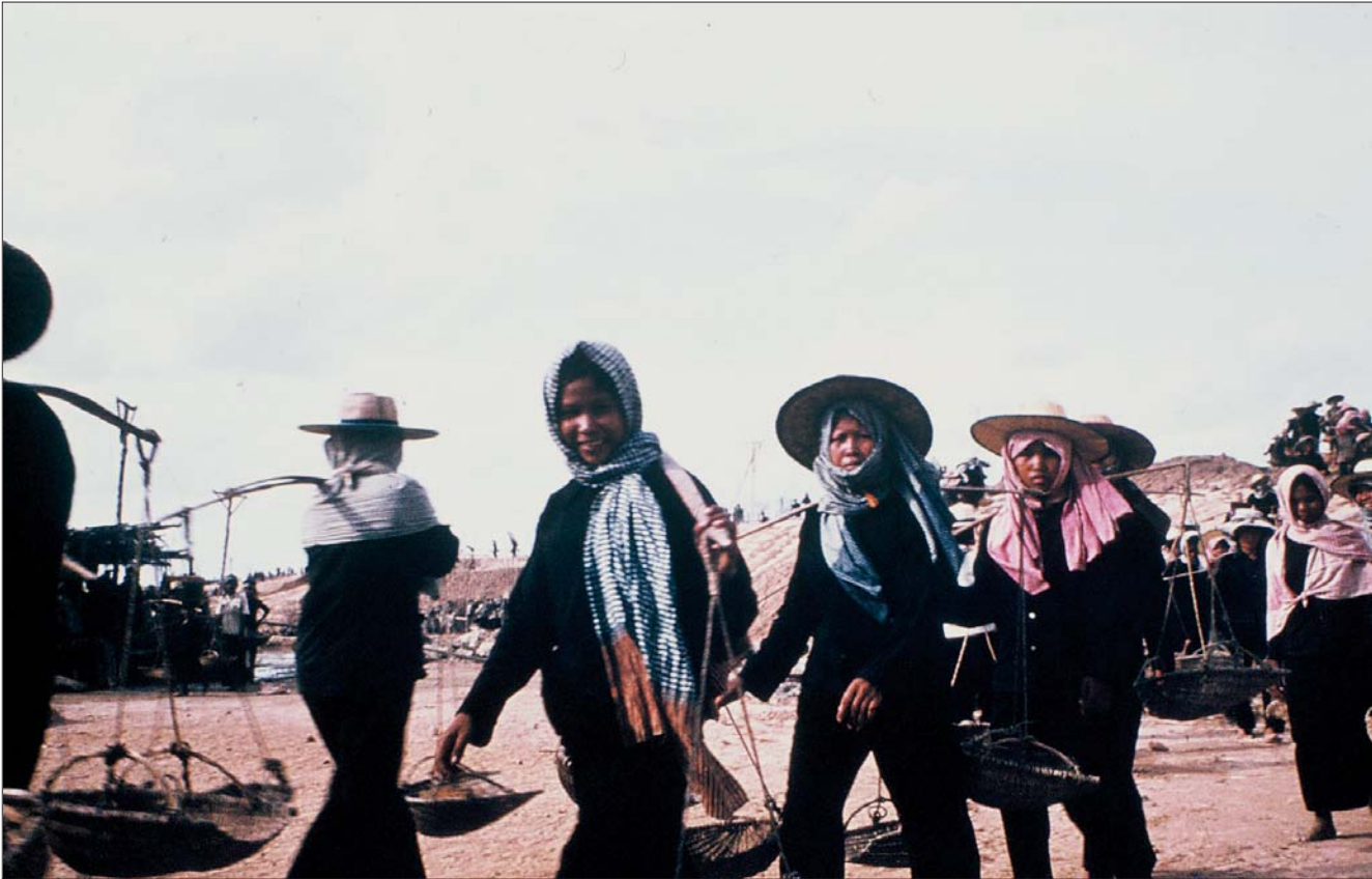
ការដ្ឋានសាលាសង្ឃមន្ត្រី