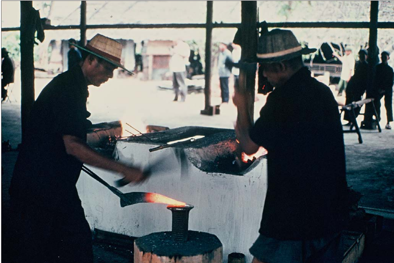
រោងជាងសហករណ៍