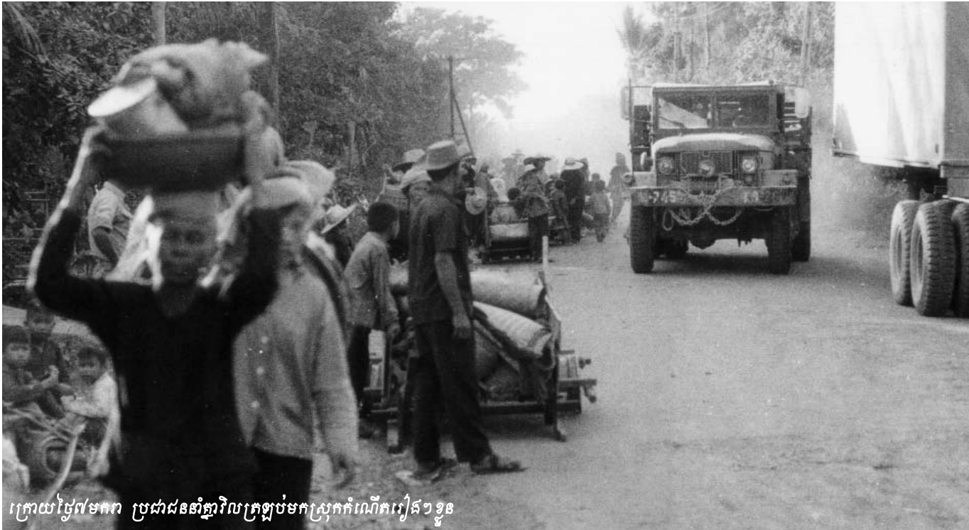
ក្រោយថ្ងៃ៧មករា ប្រជាជនទាំងឡាយត្រឡប់មកស្រុកកំណើតវៀតខ្មែរ