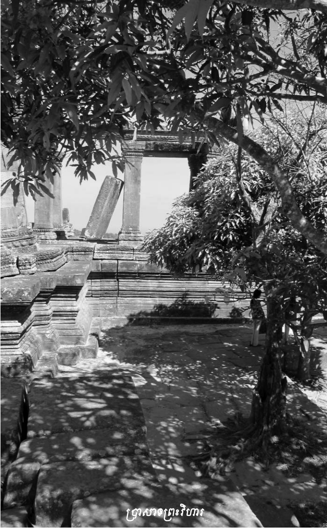
ប្រាសាទព្រះវិហារ