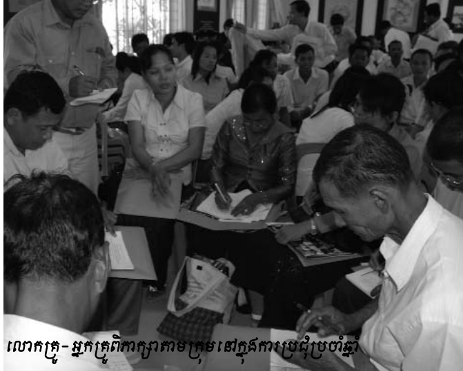
លោកគ្រូ-អ្នកគ្រូពិភាក្សាតាមក្រុមនៅក្នុងការប្រជុំប្រចាំឆ្នាំ