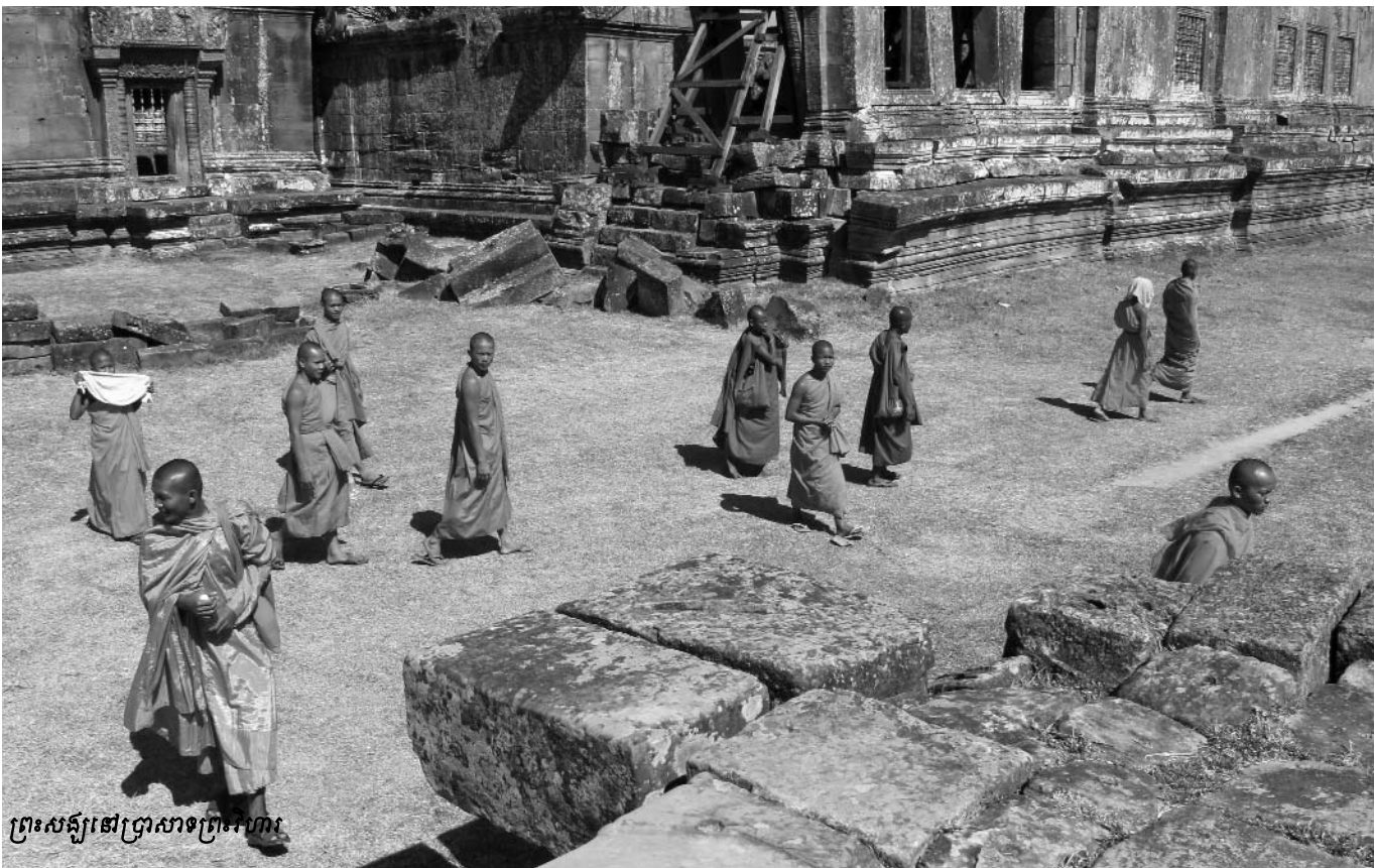
ព្រះសង្ឃនៅប្រាសាទព្រះវិហារ

ផ្សា ។ សិក្ខាសាលាបានផ្តល់ឱកាសសម្រាប់ «សាកល្បង» និង ពិសោធន៍ទៅលើគំនិតជាច្រើនមុននឹងបង្កើតជាអនុសាសន៍គោល នយោបាយ និងការអនុវត្តគំនិតនោះឲ្យទៅជាទ្រង់ទ្រាយកម្រិត ជាតិ ។ ជាឧទាហរណ៍ «ទឹកដីនៃការផ្សះផ្សា» ពង្រីកឱកាសឲ្យគ្រូ បង្រៀនថ្នាក់ខេត្តដែលមកពីគ្រប់ស្រុកធ្វើការស្រាវជ្រាវពីសិស្ស និងផ្ញើអត្ថបទចំនួនបីដែលមានចំនួន១០ - ២០ ទំព័រដែលអាចបោះ ពុម្ពផ្សាយជារៀងរាល់ឆ្នាំ ។ ជាផ្នែកមួយនៃ «ទឹកដីនៃការផ្សះ ផ្សា» ជារៀងរាល់ឆ្នាំនឹងមានការប្រមូលតែឯកសេចក្តីចំនួន៥៤០ ច្បាប់ ហើយនឹងមានការបោះពុម្ពជាសៀវភៅ និងចែកចាយ ទូទាំងប្រទេសដើម្បីបំពេញបន្ថែមទៅលើសម្ភាររបស់កម្មវិធីអប់រំ ប្រវត្តិសាស្ត្រកម្ពុជាប្រជាធិបតេយ្យនៅកម្ពុជា ។ អាស្រ័យហេតុ នេះ ដូចដែលបានកត់សម្គាល់នៅខាងលើ គម្រោងអប់រំអំពី ប្រល័យពូជសាសន៍នៅកម្ពុជាតម្រូវឲ្យសិក្ខាកាមក្នុងសិក្ខាសិលា នៅព្រះវិហារទាំងអស់ធ្វើការស្រាវជ្រាវ និងផ្ញើអត្ថបទដែលពាក់ព័ន្ធ នឹងភូមិដែលខ្លួនបង្រៀនចំនួន១០ - ២០ ទំព័រ ។ ការធ្វើបែបនេះ អនុញ្ញាតឲ្យអ្នករៀបចំអាចវាយតម្លៃពីភាពជោគជ័យនៃផែនការ