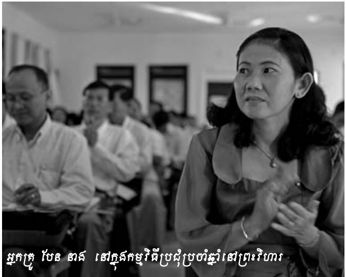
អ្នកក្រុម បែន ណាត នៅក្នុងកម្មវិធីប្រជុំប្រចាំឆ្នាំនៅព្រះវិហារ

របស់ខ្ញុំរហូតដល់កូនៗក្លាយជាមនុស្សចេះដឹង ។ ខ្ញុំប្រៀនក្មេងៗ ដំនាន់ក្រោយឲ្យយល់ពីប្រវត្តិសាស្ត្រខ្មែរក្រហមមិនមែនឲ្យក្មេងៗ ទាំងនេះចង់កំនុំទេ តែដើម្បីជួយឲ្យក្មេងៗ ចេះសាមគ្គីគ្នា» ។ ជាមួយ គ្នានេះដែរ ក្រុមប្រៀនថ្នាក់ខេត្តក៏មានទស្សនៈស្រដៀងគ្នានេះដែរ ហើយបាននិយាយថា «យើងត្រូវតែយល់ថាគម្រោងនេះគឺធ្វើ ឡើងដើម្បីការផ្សះផ្សារនិងអធ្យាស្រ័យគ្នាទៅវិញទៅមក» ។ ទស្សនៈទាំងអស់នេះត្រូវបានលើកឡើងនៅក្នុងសិក្ខាសាលាខេត្ត ព្រះវិហារដោយក្រុមប្រៀនទាំងអស់ស្របពេលដែលលោកក្រុម អ្នកប្រឹក្សាបន្តបង្ហាញពីការយល់ឃើញថា គម្រោងអប់រំប្រវត្តិសាស្ត្រ កម្ពុជាប្រជាធិបតេយ្យគឺជាមធ្យោបាយមួយដែលនាំឆ្ពោះទៅរក ការផ្សះផ្សារនិងការយល់ដឹងពីសារសំខាន់របស់ខ្លួនក្នុងនាមជាក្រុម ប្រៀននិងជាអ្នកដឹកនាំនៅតាមសហគមន៍ដើម្បីចូលរួមបង្កើត