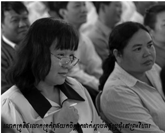
លោកគ្រូនិងលោកគ្រូកំពុងយកចិត្តទុកដាក់ស្តាប់អង្គប្រជុំនៅព្រះវិហារ

ជាសរុបមក អត្ថបទទាំងអស់នេះអាចនឹងផ្តល់ចម្លើយថា ហេតុអ្វីបានជាអំពើប្រល័យពូជសាសន៍កើតឡើង លើកឡើងពីវិធី ដែលអាចជំរុញមានការទទួលស្គាល់ពីជនដែលឆ្លុះបញ្ចាំងពីការ តស៊ូរបស់សហគមន៍កម្ពុជាក្នុងការតស៊ូដើម្បីរស់ និងកសាង