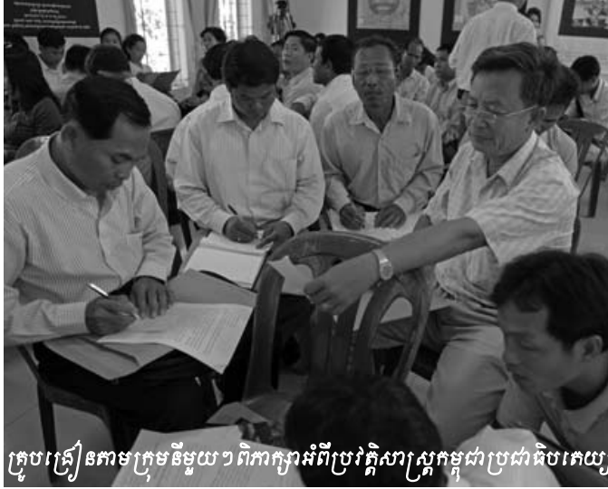
គ្រូបង្រៀនតាមក្រុមនិមួយៗពិភាក្សាអំពីប្រវត្តិសាស្ត្រកម្ពុជាប្រជាធិបតេយ្យ

ជីវភាពរស់នៅសាជាថ្មីម្តងទៀតនិងបង្ហាញពីស្ថានភាពរស់នៅ របស់ប្រជាជនកម្ពុជានាពេលបច្ចុប្បន្ននេះ ។ បន្ថែមពីលើនេះ ឯកសារចងក្រងនេះនឹងត្រូវយកមកប្រើប្រាស់នៅតាមសាលារៀន ទូទាំងប្រទេសដើម្បីធ្វើជាសម្ភារសិក្សាបន្ថែមដែលនេះជាការឆ្លើយ តបនឹងការត្អូញត្អែររបស់គ្រូបង្រៀនចំពោះសៀវភៅប្រវត្តិ សាស្ត្រនេះដើម្បីជំរុញឲ្យមានលក្ខណៈ «ពិតប្រាកដមិនលម្អៀង» ដោយផ្អែកលើប្រវត្តិសាស្ត្រ ។ យោងតាមទស្សនវិស័យ «ទឹកដីនៃ ការផ្សះផ្សា» ដែលបានស្នើដោយគម្រោងអប់រំប្រវត្តិសាស្ត្រកម្ពុជា ប្រជាធិបតេយ្យ មជ្ឈមណ្ឌលឯកសារកម្ពុជានឹងអាចបោះពុម្ពរៀង រ៉ាវរបស់អ្នករស់រានមានជីវិតចំនួន៥៤០ សាច់រៀងជារៀងរាល់ឆ្នាំ ។ លើសពីនេះទៅទៀត គ្រូបង្រៀនទាំងអស់នឹងមានការទទួលខុស ត្រូវចំពោះការជំរុញលើកទឹកចិត្តឲ្យសិស្សានុសិស្សធ្វើការចង