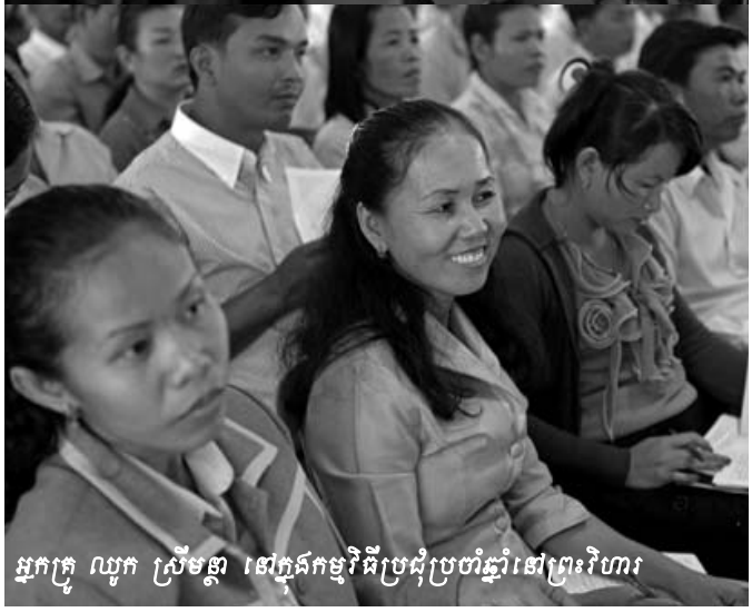
អ្នកក្រុម លូក ស្រីមន្ត នៅក្នុងកម្មវិធីប្រជុំប្រចាំឆ្នាំនៅព្រះវិហារ