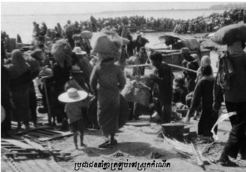
ប្រជាជននាំគ្នាទ្រង់ទ្រាយទៅស្រែកក់ណើត

ពីថ្ងៃទី១៧ មេសា ១៩៧៥ ដល់ថ្ងៃទី៧ មករា ១៩៧៧នៅក្នុងរបបកម្ពុជាប្រជាធិបតេយ្យ មានមនុស្សស្លាប់រហូតដល់ពីរលាននាក់ ។ តួលេខ មួយចំនួនបានបញ្ជាក់ថាមានមនុស្សស្លាប់ដល់ទៅ បីលាននាក់ ។ អ្នកខ្លះទៀតថាមានមនុស្សស្លាប់ មួយលាននាក់ ។ ប៉ុន្តែជាទូទៅតួលេខដែលគេ