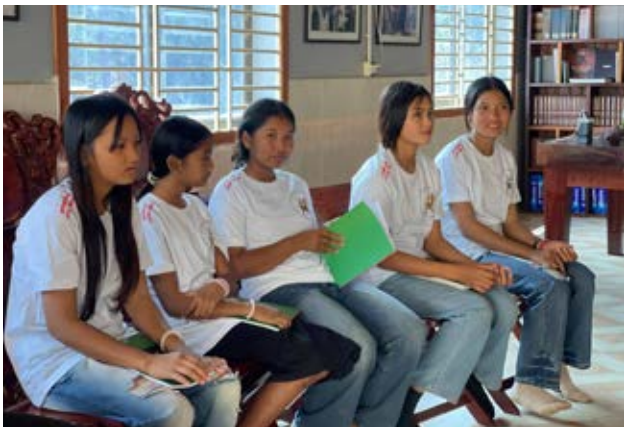
មជ្ឈមណ្ឌលសន្តិភាពអន្តរវ័យ រៀបចំវេទិកាថ្នាក់រៀនស្តីពី «ប្រវត្តិសាស្ត្រកម្ពុជា ប្រជាធិបតេយ្យ (ឆ្នាំ១៩៧៥-១៩៧៩)» ដល់សិស្សអនុវិទ្យាល័យត្រពាំងច្រើយ

ក្នុងរបបកម្ពុជា ប្រជាធិបតេយ្យ កម្ពុជាមានទំនាក់ទំនងការទូតល្អជាមួយប្រទេសចិន, កូរ៉េខាងជើង, វៀតណាម, ឡាវ, រ៉ូម៉ានី, យូហ្គេស្លាវី, អាណានិគម និងអេហ្ស៊ីប។ ហេតុដូច្នេះនេះ ការមានទំនាក់ទំនងការទូតល្អជាមួយបណ្តាប្រទេសផ្សេងៗគឺជាការបង្ហាញពីមិត្តភាពរវាងប្រទេសនិងប្រទេស ក្នុងការប្រាស្រ័យទាក់ទងគ្នាធ្វើកិច្ចការអ្វីមួយ។ កម្ពុជា ប្រជាធិបតេយ្យ ខិតខំពង្រីកទំនាក់ទំនងការទូតរបស់ខ្លួន និងពាណិជ្ជកម្មក្រៅប្រទេសជាមួយ ចិន កូរ៉េខាងជើង ថៃ ជប៉ុន ហុងកុង ម៉ាដាហ្គាស្ការ បង់ក្លាដេស សិង្ហបុរី ក្នុងការ