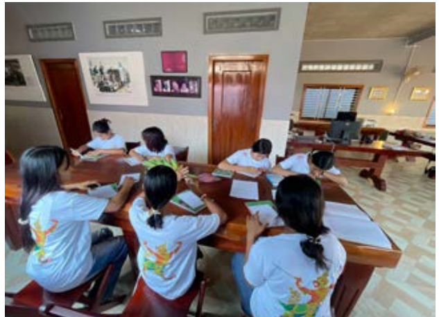
មជ្ឈមណ្ឌលសន្តិភាពអន្តរជាតិ រៀបចំវេទនាថ្នាក់រៀនស្តីពី «ប្រវត្តិសាស្ត្រកម្ពុជាប្រជាធិបតេយ្យ (ឆ្នាំ១៩៧៥-១៩៧៩)» ដល់សិស្សអនុវិទ្យាល័យត្រពាំងប្រីយ៍