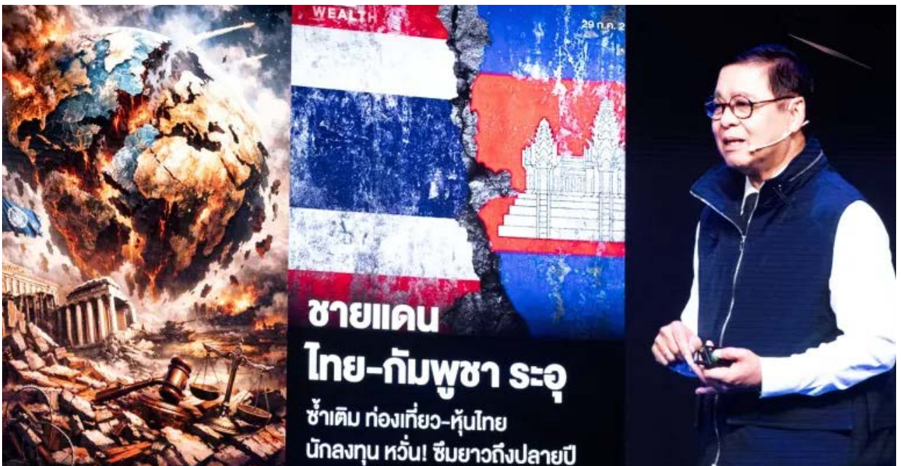
រដ្ឋមន្ត្រីការបរទេសថៃ ស៊ីហស៊ីត្តិ ភូងគេតកែវ។

ការបោះឆ្នោតនៅប្រទេសថៃគឺជាការប្រឡងប្រឡងផ្ទៃក្នុងរបស់ថៃ។ ការបោះឆ្នោតនៅក្នុងប្រទេសថៃគឺជាកត្តាសំខាន់មួយដែលជះឥទ្ធិពលទៅលើជម្រើសព្រំដែនខ្មែរ-ថៃ ប៉ុន្តែវាអាចជារឿងឆោតឆ្នើមក្នុងការដែលលើកឡើងថាការបោះឆ្នោតនេះគឺជាកត្តាជំរុញ ឬជាកម្លាំងចលករតែមួយគត់នៃបញ្ហាជម្រើសព្រំដែននេះ។