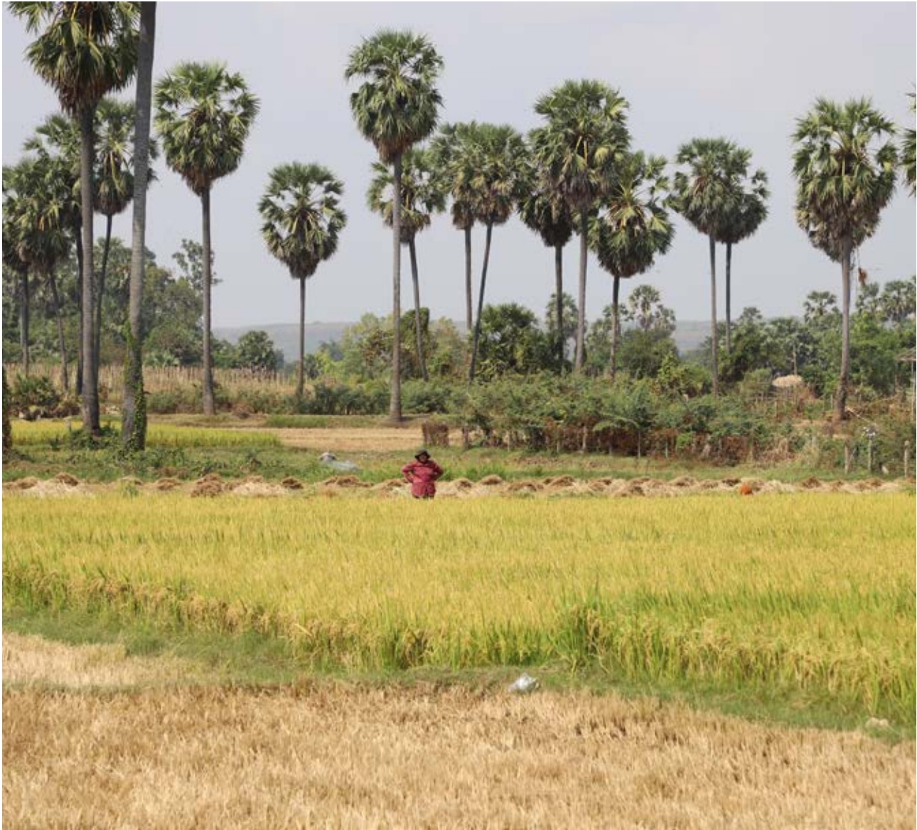
ទេសភាពវាលស្រែនៅក្នុងរដូវប្រមូលដល់នៅប្រទេសកម្ពុជា។

បន្ទាប់បន្សំឡើយ វាក៏ជាសមរម្យមួយទ្វេសាស្ត្រនៅក្នុងជម្រោះដែលបានបន្តកើតមានអស់ជាច្រើនជំនាន់មកហើយ។ ជំរុំម ការបរាជ័យក្នុងការគ្រប់គ្រងលើការពិតនៃប្រវត្តិសាស្ត្រនេះ នឹងញ៉ាំងឱ្យរឿងរ៉ាវដដែលៗនៅតែបន្តកើតមានឡើងទៅលើមនុស្សជំនាន់ក្រោយៗទៀតជាកំជាមិនខាន។