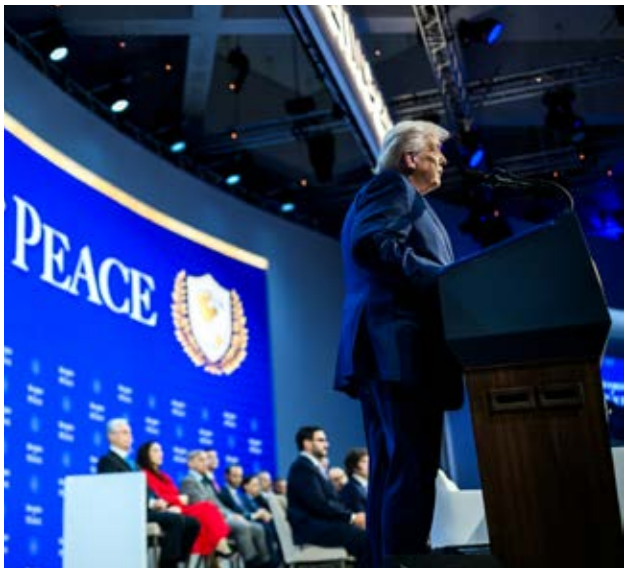
ប្រធានាធិបតីសហរដ្ឋអាមេរិក ដូណាល់ ត្រាំ ផ្តល់សប្តាច៍នៃក្រុមប្រឹក្សាសន្តិភាពក្នុងពិធីជាប្រវត្តិសាស្ត្រ ដែលបើកផ្លូវឆ្ពោះទៅរកក្តីសន្តិភាព និងសេចក្តីថ្លៃថ្នូរសម្រាប់ប្រជាជនហ្គាហ្សា ថ្ងៃទី២២ ខែមករា ឆ្នាំ២០២៦។

ទន្ទឹមនឹងនេះដែរ ខណៈពេលដែលប្រទេសថៃត្រូវបានអញ្ជើញឱ្យចូលរួមក្នុង «ក្រុមប្រឹក្សាសន្តិភាព» ពីរដ្ឋបាលលោកប្រធានាធិបតីសហរដ្ឋអាមេរិក ដូណាល់ ត្រាំ នាយករដ្ឋមន្ត្រីថៃ លោក អានុទីន ឆានរិវិកុល បែរជាបន្តបង្ហាញបំណងដួងចិត្តមេនេះ ថា គ្រាន់តែជា