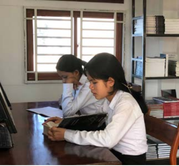
សិស្សមកពីវិទ្យាល័យ ហ៊ុន សែន ប្រមោយ មកទស្សនកិច្ចសិក្សា និងអានសៀវភៅ ប្រវត្តិសាស្ត្ររបបកម្ពុជា ប្រជាធិបតេយ្យ (១៩៧៥-១៩៧៩) នៅមជ្ឈមណ្ឌល ជំនះជម្រាលវៃវង់