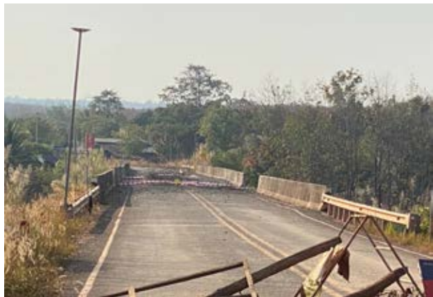
កងទ័ពអាកាសថៃម្នាក់គ្រាប់បែកពីយន្តហោះ F-16 ផ្តាច់ស្ពាន មេទឹក ឬស្ពានជ័យជម្នះ ក្នុង ស្រុកវាលវែង ខេត្តពោធិ៍សាត់

ភាគីថៃកំពុងប្តូរនិយមន័យដីកម្ពុជា ខណៈពេលដែលលោកលនយោបាយការបរទេសរបស់ សហរដ្ឋអាមេរិកកំពុងមានការប្រែប្រួល។ នេះជារឿង ដដែលៗ កើតមានឡើងជាច្រើនលើកជាច្រើនសារមក ហើយ។ នៅពេលដែលមានការរង្គោះរង្គើនៃអំណាច ភាគីថៃតែងតែតិតថាវាគឺជាទឹកស្វយ័ត ប្រសិនបើកម្ពុជា ដណ្តើមយកទឹកដីថៃវិញ ក្នុងរូបភាពជាការរក្សា សន្តិសុខជាតិដូចគ្នាដែរនោះ តើភាគីថៃនឹងតិតយ៉ាង ដូចម្តេច? ប្រសិនបើព្រឹត្តិការណ៍នេះកើតឡើងមែននោះ សង្គ្រាមដ៏ក្តៅកកប្រាកដជាកើតមានជាក់ជាមិនខាន។