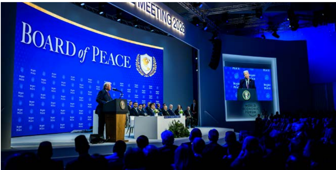
ប្រធានាធិបតីសហរដ្ឋអាមេរិក ដូណាល់ ត្រាំ ផ្តល់សច្ចាប័ណ្ណលើក្រុមប្រឹក្សាសន្តិភាពក្នុងពិធីជាប្រវត្តិសាស្ត្រ ដែលបើកផ្លូវឆ្ពោះទៅរកក្តីសន្តិភាព និងសេចក្តីថ្លៃថ្នូរសម្រាប់ប្រជាជនហ្គាហ្សា ថ្ងៃទី២២ ខែមករា ឆ្នាំ២០២៦។

នៅថ្ងៃទី២២ ខែមករា ឆ្នាំ២០២៦ មានព័ត៌មានថា ប្រទេសកម្ពុជាបានទទួលយកការអញ្ជើញជាផ្លូវការពីរដ្ឋបាលលោកប្រធានាធិបតីសហរដ្ឋអាមេរិក ដូណាល់ ត្រាំ ដើម្បីចូលរួម «ក្រុមប្រឹក្សាសន្តិភាព» ដែលនេះគឺជាការបង្ហាញអំពីសន្តិភាព និងការប្តេជ្ញាចិត្តរបស់កម្ពុជាចំពោះសន្តិភាពជាសកល។ នេះគឺជាឱកាសជាប្រវត្តិសាស្ត្រ និងជាកិត្តិយសដ៏ខ្ពង់ខ្ពស់បំផុតសម្រាប់កម្ពុជា។ នេះគឺជាឱកាសមួយសម្រាប់ពិភពលោកក្នុងការឈ្លងយល់អំពីគំនិតផ្តួចផ្តើមប្រកបដោយថាមពល និងយុទ្ធសាស្ត្រច្នៃប្រឌិតថ្មីៗ