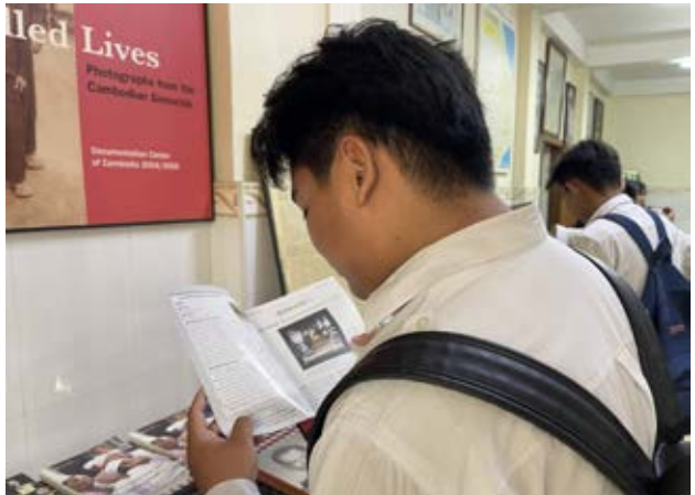
មជ្ឈមណ្ឌលឯកសារខេត្តតាកែវ រៀបចំវេទនាថ្នាក់រៀនក្រោម ប្រធានបទ «គោលការណ៍៨ចំណុចរបស់ខ្មែរក្រហម» និងការ ជម្លៀសប្រជាជនដោយបង្ខំក្នុងរបបខ្មែរក្រហម ដល់សិស្ស វិទ្យាល័យ ជា ស៊ីម តាកែវ។

បើប្រៀបធៀបពីការជម្លៀសក្នុងរបបខ្មែរក្រហម និងការកៀសខ្លួនបច្ចុប្បន្នសង្គ្រាមត្រង់ថោះ ការជម្លៀស នាពេលបច្ចុប្បន្ន យើងអាចយកអ្វីៗដែលជារបស់ ផ្ទាល់ខ្លួនទៅតាមបានដោយសេរី មិនមានការបង្ខិត បង្ខំ ជាពិសេសយើងអាចទៅជួបជុំគ្រួសារ និងមាន ស្បៀងអាហារគ្រប់គ្រាន់ក្នុងពេលធ្វើដំណើរ។ រីឯការ ជម្លៀសក្នុងរបបខ្មែរក្រហមវិញ យើងមិនអាចយក របស់របរតាមខ្លួនបានទេ ព្រោះមានការត្រួតពិនិត្យពី ក្រុមខ្មែរក្រហម។ ប្រជាជនត្រូវឃ្នាតឆ្ងាយពីសាច់ ញាតិបងប្អូន ព្រមទាំងត្រូវធ្វើដំណើរផ្លូវឆ្ងាយ គ្មាន ពេលឈប់សម្រាក ជាពិសេសទទួលបាននូវការបង្ខិត បង្ខំពីក្រុមខ្មែរក្រហម។