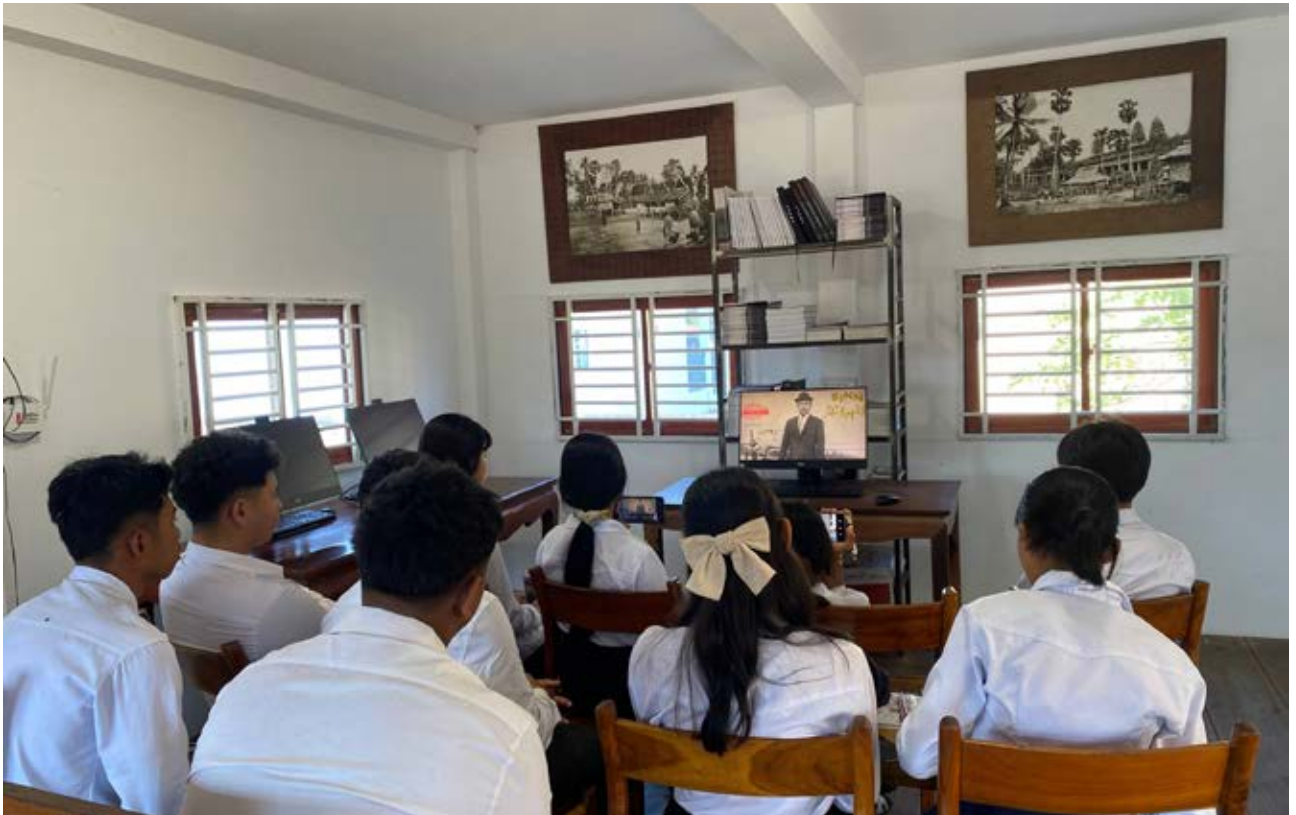
សិស្សមកពីវិទ្យាល័យ ហ៊ុន សែន ប្រមោយ មកទស្សនកិច្ចសិក្សា និងអានសៀវភៅ ប្រវត្តិសាស្ត្ររបបកម្ពុជា ប្រជាធិបតេយ្យ (១៩៧៥-១៩៧៩) នៅមជ្ឈមណ្ឌលជំនះជម្រាលវៃវង់

មកអានសៀវភៅ និងចូលរួមរៀនសូត្រអំពីប្រវត្តិសាស្ត្រខ្មែរក្រហមបន្តទៀត។