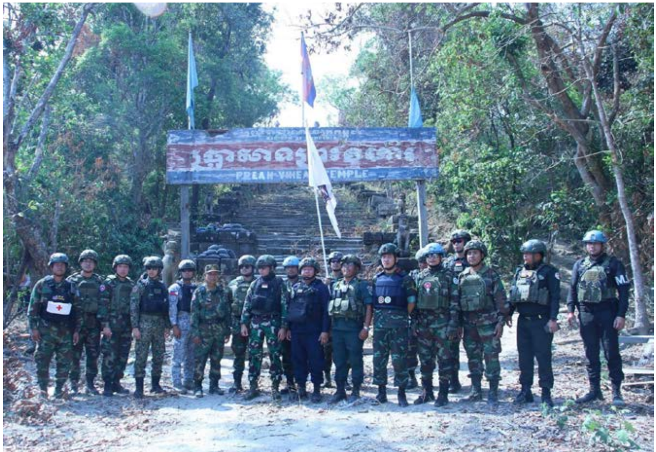
ក្រុមសង្កេតការណ៍អាស៊ានចុះពិនិត្យស្ថានភាពបាក់បែកនៅប្រាសាទព្រះវិហារដោយសារការបាញ់ផ្លោង និងទម្លាក់គ្រាប់បែកពី យោធាថៃ

សូមកុំយល់ច្រឡំ ឡើយ វិវាទអន្តរជាតិនិងប្រវត្តិសាស្ត្រ ដែលអូសបន្លាយជាច្រើនជំនាន់ជុំវិញបញ្ហាព្រំដែន គឺមិនអាចដោះស្រាយបានតាមរយៈ ព្រឹត្តិការណ៍តែ មួយ ដូចជាការបោះឆ្នោត ឬកិច្ចព្រមព្រៀងសន្តិភាព នោះទេ កម្ពុជាត្រូវតែត្រៀមខ្លួនជាមួយនឹងយុទ្ធសាស្ត្រ ពហុវិមាត្រ និងដែលមានលក្ខណៈជាច្រើនជំនាន់។