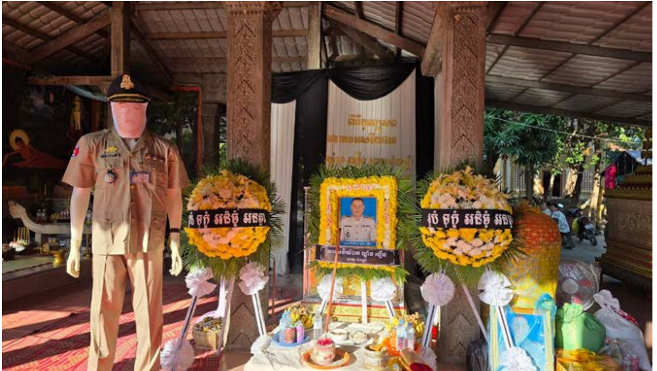
ពិធីបុណ្យសពវីរនករចាល យ៉ាង ធឿន ( បណ្ណសារមជ្ឈមណ្ឌលឯកសារកម្ពុជា )

ខ្ញុំឈ្មោះ ខុច ភារុន អាយុ៤៤ឆ្នាំ ត្រូវជាប្រពន្ធ របស់ យ៉ាង ធឿន។ ខ្ញុំមានស្រុកកំណើតនៅភូមិ កោកមន ឃុំកោកមន ស្រុកបន្ទាយអំពិល ខេត្តត្បូង- មា នជ័យ។ បច្ចុប្បន្នខ្ញុំរស់នៅ ភ្នំភូមិយុវជន វិល។ ខ្ញុំមានកូនចំនួន២នាក់ គឺប្រុសម្នាក់ និងស្រីម្នាក់។ កូនប្រុសច្បងរបស់ខ្ញុំមានអាយុ១៥ឆ្នាំ និងកូនស្រីពៅ អាយុ១៣ឆ្នាំ។ ខ្ញុំជាមួយប្តីរបស់ខ្ញុំបានស្គាល់គ្នា តាំងពីនៅក្មេងមកម៉្លោះ។ ខ្ញុំនិងប្តីរស់នៅភូមិក្បូរក្នា គឺខ្ញុំរស់នៅភូមិកោកមន ចំណែកឯប្តីខ្ញុំរស់នៅភូមិកា