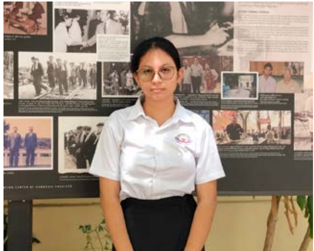
សិស្សវិទ្យាល័យ ហ៊ុន សែន កំពង់ឆ្នាំង ចូលរួមវេទិកា បង្ហាញនូវប្រវត្តិសាស្ត្រកម្ពុជាប្រជាធិបតេយ្យ ( ១៩៧៥- ១៩៧៩) នៅមជ្ឈមណ្ឌលឯកសារខេត្តព្រៃវែង

ធ្វើសង្គ្រាម យើងគួររៀនសូត្រពីសង្គ្រាមឱ្យបាន ច្បាស់ ថាសង្គ្រាមបានផ្តល់ដល់អរិយធម៌ខ្លះ មកដល់ប្រទេសជាតិ។