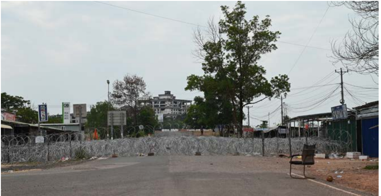
៣ ហា នៃថវាយ លូ សបន្តា ពីទ្វេយកដី និង លំនៅ ថា នប្រជាជនកម្ពុជា នៅ ប្រកប្រាំដៃនៃដី ក្នុង ស្រុកវាលវែង ខេត្តពោធិ៍សាត់

ភាគីថៃកំពុងប្តូរនិយមន័យដីកម្ពុជា ខណៈពេលដែលលោកលនយោបាយការបរទេសរបស់ សហរដ្ឋអាមេរិកកំពុងមានការប្រែប្រួល។ នេះជារឿង ដដែលៗ កើតមានឡើងជាច្រើនលើកជាច្រើនសារមក ហើយ។ នៅពេលដែលមានការរង្គោះរង្គើនៃអំណាច ភាគីថៃតែងតែតិតថាវាគឺជាទឹកស្វយ័ត ប្រសិនបើកម្ពុជា ដណ្តើមយកទឹកដីថៃវិញ ក្នុងរូបភាពជាការរក្សា សន្តិសុខជាតិដូចគ្នាដែរនោះ តើភាគីថៃនឹងតិតយ៉ាង ដូចម្តេច? ប្រសិនបើព្រឹត្តិការណ៍នេះកើតឡើងមែននោះ សង្គ្រាមដ៏ក្តៅកកប្រាកដជាកើតមានជាក់ជាមិនខាន។