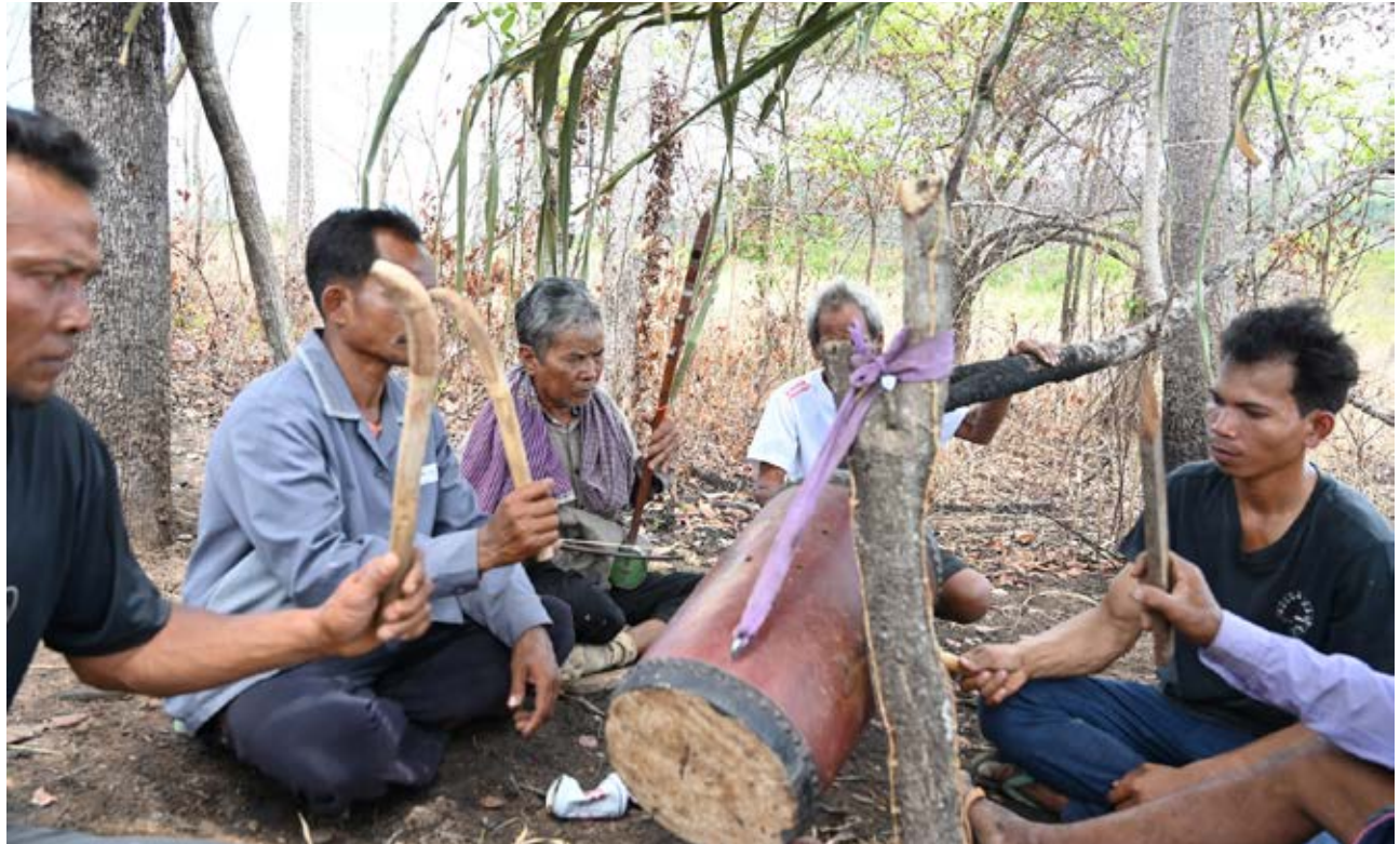
ពិធី ឡើងអង្គការបស់ដេវតិដើមភាគតិចពីរ នៅ ទួលក្រស និង ទួលកកោះ ក្នុងភូមិស្ទឹងថ្មី ឃុំប្រមោយ ស្រុកវាលវែង ខេត្តពោធិ៍សាត់។