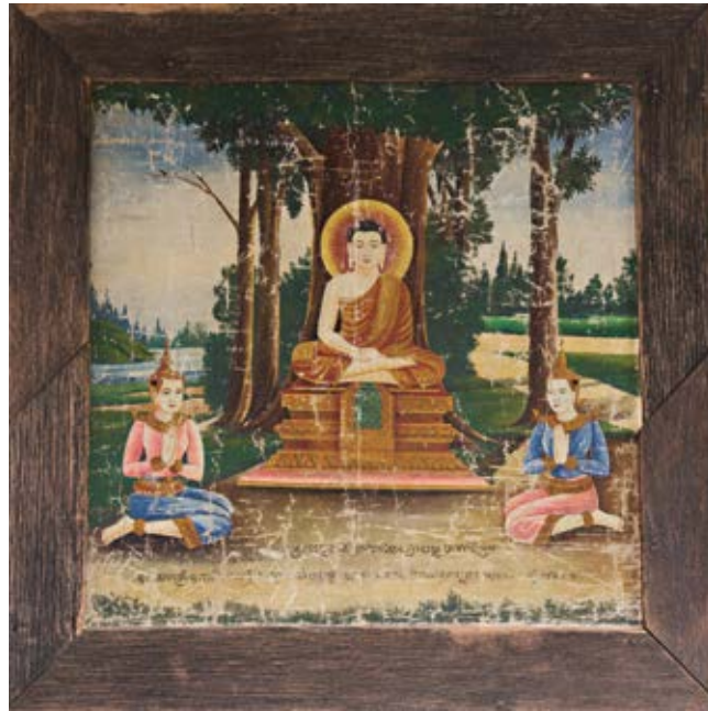
ព្រះសម្មាសម្ពុទ្ធកំពុងសមាធិនៅក្រោមដើមពោធិ៍ ដោយមានទេវតាពីរអង្គសំពះប្រណម្យ គោរពបូជាព្រះអង្គដោយសេចក្តីជ្រះថ្លា។

ការពិភពគឺជារូត្យដែលមិនអាចកាត់ថ្លៃបាននៅក្នុងយុគសម័យព័ត៌មាន ហើយនៅក្នុងទម្រង់ជាច្រើនការពិភពមានតម្លៃជាងមាសទៅទៀត ពីព្រោះថាការពិភពគឺជាពាក្យស្នេហា រក្សា និងការពារជាងលោហៈ ធាតុមានតម្លៃណាៗទាំងអស់។