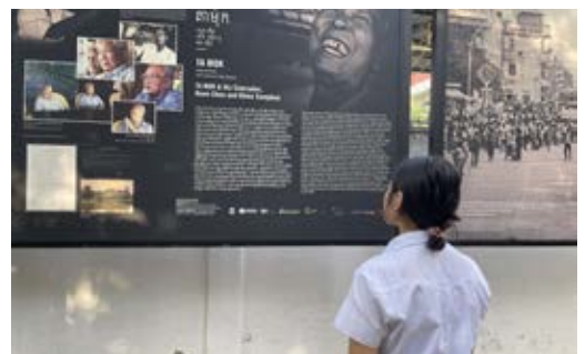
មជ្ឈមណ្ឌលឯកសារខេត្តតាកែវ រៀបចំវេទិកាថ្នាក់រៀនក្រោមប្រធានបទ «គោលការណ៍៨ចំណុចរបស់ខ្មែរក្រហម» និងការដម្លៀសប្រជាជន ដោយបង្ខំក្នុងរបបខ្មែរក្រហម ដល់សិស្សវិទ្យាល័យ ជា ស៊ីម តាកែវ

កាលពីថ្ងៃទី១៧ ខែកុម្ភៈ ឆ្នាំ២០២៦ កន្លងមក មជ្ឈមណ្ឌលឯកសារកម្ពុជា សាខាខេត្តតាកែវ បានរៀបចំវេទិកាថ្នាក់រៀនក្រោមប្រធានបទ «គោលការណ៍៨ចំណុចរបស់ខ្មែរក្រហម» និងការដម្លៀសប្រជាជន ដោយបង្ខំក្នុងរបបខ្មែរក្រហម ដល់សិស្សានុសិស្សចំនួន២៥នាក់ មកពីវិទ្យាល័យ ជា ស៊ីម តាកែវ។ គោលបំណងសំខាន់នៃវេទិកានេះ គឺដើម្បីបង្កើនការយល់ដឹងអំពីប្រវត្តិសាស្ត្រខ្មែរក្រហមជាពិសេសស្វែងយល់ស៊ីជម្រៅពីគោលការណ៍៨ចំណុចរបស់ខ្មែរក្រហម ដែលឈានដល់ការបាត់បង់ជីវិតមនុស្សរាប់លាននាក់។