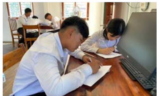
សិស្សមកពីវិទ្យាល័យ ហ៊ិន វ៉ែន ប្រម៉ោយ មកទស្សនកិច្ចសិក្សា និងអានសៀវភៅប្រវត្តិសាស្ត្ររបបកម្ពុជាប្រជាធិបតេយ្យ (១៩៧៥-១៩៧៩) នៅមជ្ឈមណ្ឌលផ្សះផ្សារវាលវែង

នៅវេលាព្រឹកថ្ងៃទី៥ខែកុម្ភៈ ឆ្នាំ២០២៦ សិស្សានុសិស្សមកពីវិទ្យាល័យ ហ៊ិន វ៉ែន ប្រម៉ោយ ចំនួន ១០នាក់ បានមកទស្សនកិច្ចសិក្សា និងអានសៀវភៅប្រវត្តិសាស្ត្រ ទាក់ទងនឹងរបបកម្ពុជាប្រជាធិបតេយ្យ (១៩៧៥-១៩៧៩) នៅមជ្ឈមណ្ឌលផ្សះផ្សារវាលវែងដើម្បីជំនួយដល់ការសិក្សារៀនសូត្រនៅក្នុងសាលារៀន។ ក្នុងឱកាសនោះ ក្រុមការងារមជ្ឈមណ្ឌលផ្សះផ្សារវាលវែងក៏បានចាក់បញ្ចាំងខ្សែភាពយន្តឯកសារមានចំណង ជើងថា «កុំស្មានបងភ្លេច» ឱ្យសិស្សទស្សនា។ ខ្សែភាពយន្តឯកសារនេះ បានផ្សារភ្ជាប់ទៅនឹងរឿងរ៉ាវប្រវត្តិសាស្ត្រប្រទេសកម្ពុជា