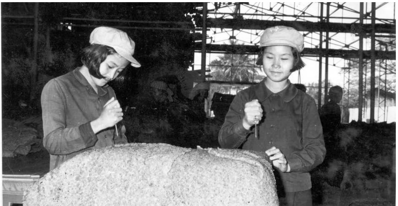
មិត្តនារីកម្មករនៅរោងចក្រដលិតដីរកៅ ស្ទីក្រែបនៅក្នុងរបបកម្ពុជាប្រជាធិបតេយ្យ (១៩៧៥-១៩៧៩)។