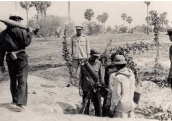
កងទ័ពខ្មែរក្រហមនៅលើសមរក្ខមិយ

ដោយភាពភ័យខ្លាចដ៏ខ្លាំងយ៉ាងកក់ក្តៅបំផុត ញឹម ថ្ងៃ១២.៨.៧៧ ទទួល ថ្ងៃ១៣.៨.៧៧ ម៉ោង៖ ០៨-១៥នាទី