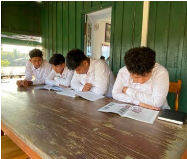
សិស្សមកពីវិទ្យាល័យ ហ៊ុន សែន ប្រមោយ មកទស្សនាសិក្សា និងអានសៀវភៅ ប្រវត្តិសាស្ត្ររបបកម្ពុជាប្រជាធិបតេយ្យ (១៩៧៥-១៩៧៧) នៅមជ្ឈមណ្ឌលផ្សះផ្សារវាលវែង