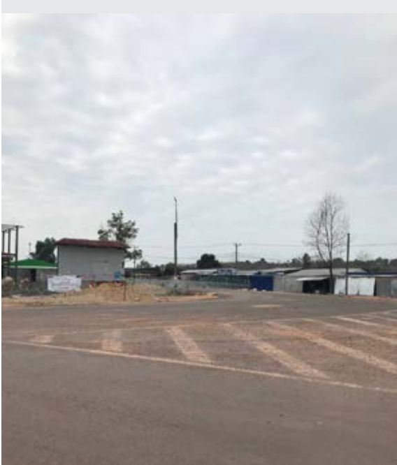
ទាហានថែរក្សាល្វីសបន្ទាត់ខ្យងកងទ័ព និងលំនៅឋានប្រជាជនកម្ពុជា នៅប្រកប្រតិបត្តិការស្រុកវាលវែង ខេត្តពោធិ៍សាត់។