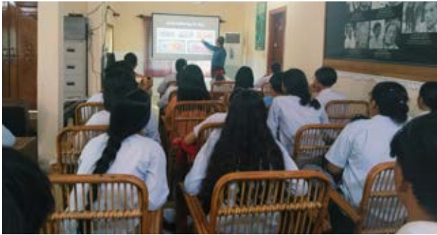
មជ្ឈមណ្ឌលឯកសារខេត្តតាកែវ រៀបចំវេទិកាថ្នាក់រៀន ក្រោមប្រធានបទ «គោលការណ៍ដ៏ចំណុចរបស់ខ្មែរក្រហម» និងការជម្លៀសប្រជាជនដោយបង្ខំក្នុងរបបខ្មែរក្រហម ដល់សិស្សវិទ្យាល័យ ជា ស៊ីម តាកែវ។