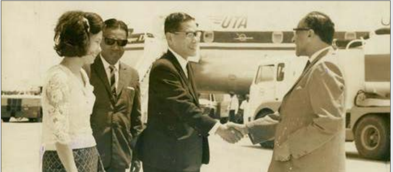
អ្នកប៊ុនថេន នៅ ព្រលានយន្តហោះ ទីក្រុងរីងហ្គុន ប្រទេសកូរ៉េ ឆ្នាំ១៩៦៧