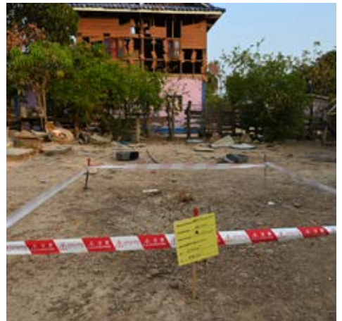
៣ ហា នៃថ្នាក់រដ្ឋ និង ទម្រង់ក្រាបបែកមកលើផ្ទះ សម្បែង ភូមិវ៉ាន និង ទ្រព្យសម្បត្តិរបស់ប្រជាជនកម្ពុជានៅក្នុងស្រុកថ្មពួក ខេត្តបន្ទាយមានជ័យ។