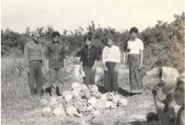
អង្គការកុមារនៃគ្រោះដែលឆ្លាំភ្នែកសម្លាប់រួចកប់ក្នុង រណ្តៅសាកសពរួម នៅអតីតមន្ទីរសន្តិសុខក្រាំងតាចាន់ ស្ថិតនៅក្នុងស្រុកត្រាំកក់ ខេត្តតាកែវ។ អង្គការកុមារនៃគ្រោះ ទាំងនោះត្រូវបានរដ្ឋដំណាច់ កាត់យកមករក្សាទុកនៅ ស្ថាប័នមូលអង្គការក្រាំងតាចាន់ ក្រោយរបបខ្មែរក្រហម ដួលរលំនៅថ្ងៃទី៧ ខែមករា ឆ្នាំ១៩៧៧។