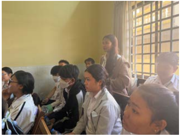
មជ្ឈមណ្ឌលឯកសារខេត្តព្រៃវែង រៀបចំវេទិកាថ្នាក់រៀនក្រោមប្រធានបទ «ដល់ប៉ះពាល់និងតម្រូវការចាំបាច់សម្រាប់ប្រជាជនភៀសស៊ីក» ដល់សិស្សវិទ្យាល័យ ហ៊ុន សែន កំពង់លាវ។

«តម្រូវការចាំបាច់សម្រាប់ប្រជាជនជម្លោះស ប្រជាជនភៀសខ្លួន និង ភៀសស៊ីក ដើម្បីការរស់រាននជីវិតពីហេតុការណ៍ជាប្រវត្តិសាស្ត្រទាំងនោះ។ គ្រូទូទៅសប្បុរសឆ្លើយតបលើតម្រូវការខុសគ្នារបស់ប្រជាជនសម្រាប់ព្រឹត្តិការណ៍ខុសគ្នា។ តម្រូវការរបស់ប្រជាជននៅក្នុងរបបខ្មែរក្រហម គឺត្រូវការហូបចុកគ្រប់គ្រាន់ និងរកវិធីសាស្ត្រដើម្បីបានហូបឆ្កែត។ តម្រូវការរបស់ប្រជាជនភៀសខ្លួនគឺ សុខសុវត្ថិភាព និងសន្តិភាព ដែលជាមូលហេតុនាំឱ្យអ្នកទាំងនោះភៀសខ្លួនទៅកាន់ប្រទេសទី៣ ដើម្បីអាចមានជីវិតរស់នៅប្រសើរជាងមុន។ ចំណែកតម្រូវការប្រជាជនភៀសស៊ីកវិញ គឺសន្តិភាព ស្ថិរភាពសង្គម និងគ្មានសង្គ្រាម។ វាគួរនឹកបានពីកងលំសិស្សានុសិស្សអំពីមូលដ្ឋានគ្រឹះក្នុងការថែរក្សាសន្តិភាពបានគឺទប់ស្កាត់កុំឱ្យមានសង្គ្រាម រៀនពីសង្គ្រាម និងត្រៀមខ្លួនដើម្បីធ្វើសង្គ្រាម។