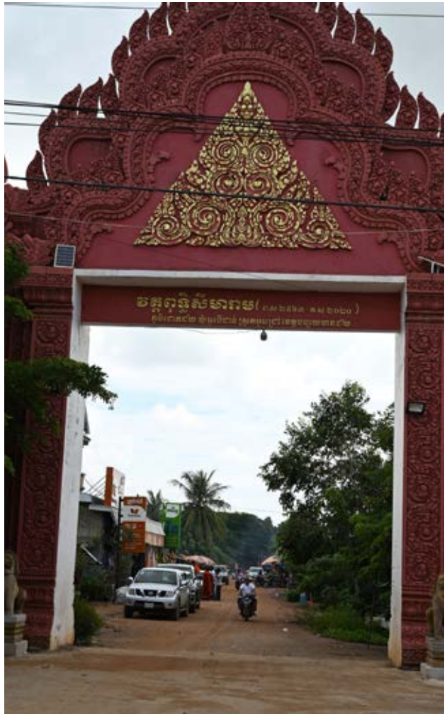
ខោងទ្វារវត្តជោកដ៏យស្ថិតនៅក្នុងភូមិជោកដ៏យ ឃុំអូរដំរី ស្រុកអូរជ្រៅ ខេត្តប៉ៃលិនមានដើម (បណ្តាសារមជ្ឈមណ្ឌលឯកសារកម្ពុជា)

ចំណែកបង្គោល ឡាក់ព្រំដែនស្ថិតនៅខាងលិចឈាង ខាងជើងប្រាសាទស្តុកកក់ធំ ប្រហែល២គីឡូម៉ែត្រ ត្រូវបានប្តូរទីតាំងមកបែកខាងកើតប្រាសាទស្តុកកក់ ធំប្រមាណ២គីឡូម៉ែត្រវិញ។ ទាហានថៃមិនអនុញ្ញាត ឱ្យអង្គការខ្ញុំទៅឈរជើងនៅក្បែរប្រាសាទស្តុកកក់ ធំឡើយ។ អង្គការខ្ញុំបានមកឈរជើងនៅតំបន់៥ (បច្ចុប្បន្នភូមិព្រៃចាន់) ជំនួសវិញ រហូតដល់ធ្វើ សមាហរណកម្ម ជាមួយកងយោធពលខេមរភូមិន្ទ នៅឆ្នាំ១៩៩៣។